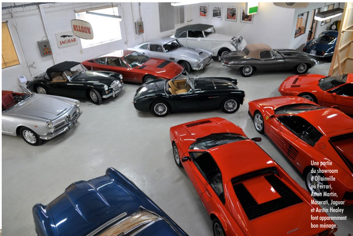
Une partie du showroom d'Ollainville où Ferrari, Aston Martin, Maserati, Jaguar et Austin Healey font apparemment bon ménage.