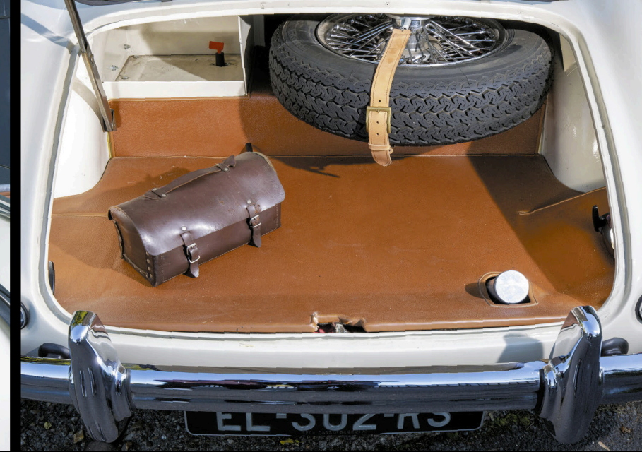
AINSI POSITIONNÉE, LA ROUE DE SECOURS DÉGAGE UN ESPACE CONSÉQUENT POUR LES BAGAGES. LA MÉCANIQUE EST FIABLE, MAIS UNE PETITE TROUSSE DE SECOURS NE NUIT PAS!