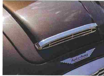
Importée des États-Unis, l'auto a fait l'objet d'une restauration intégrale dans les ateliers maison.